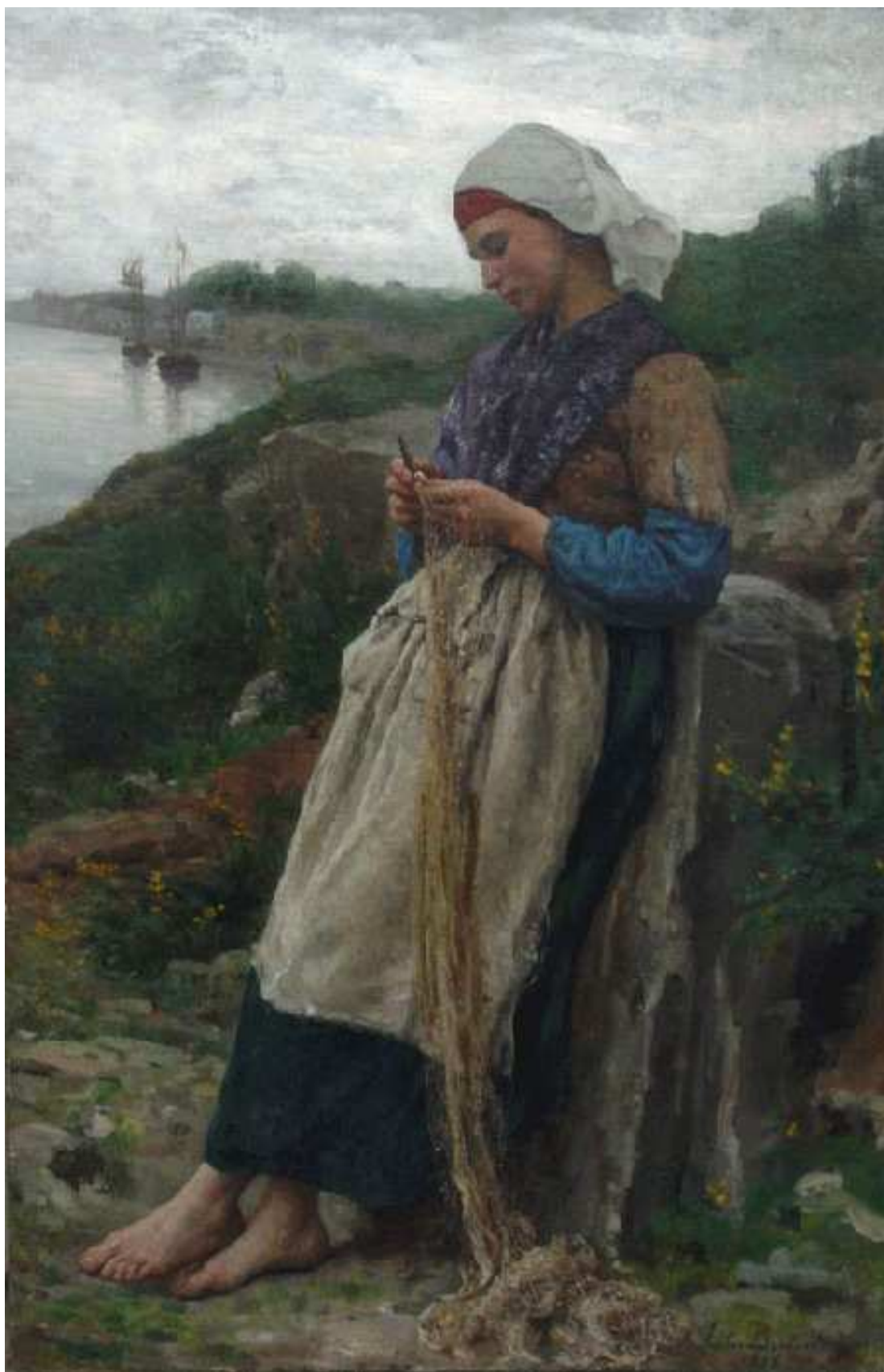
Jules Breton (1827-1906) Une fille de pêcheur (1876)