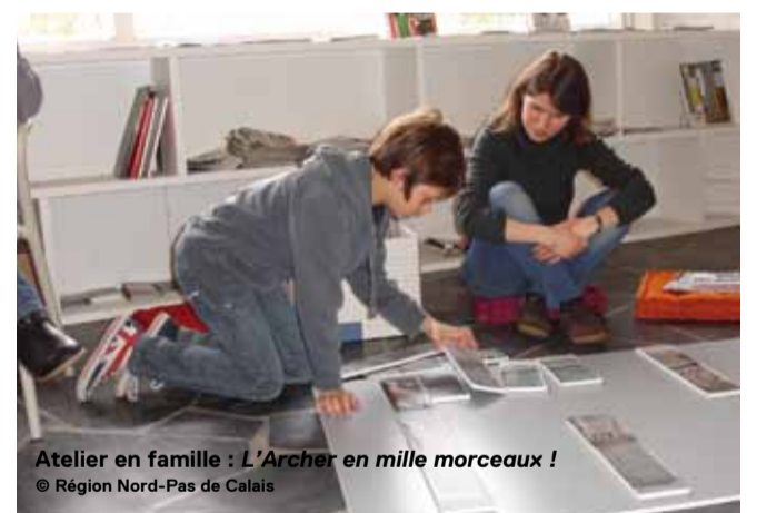
Atelier en famille : L'Archer en mille morceaux !