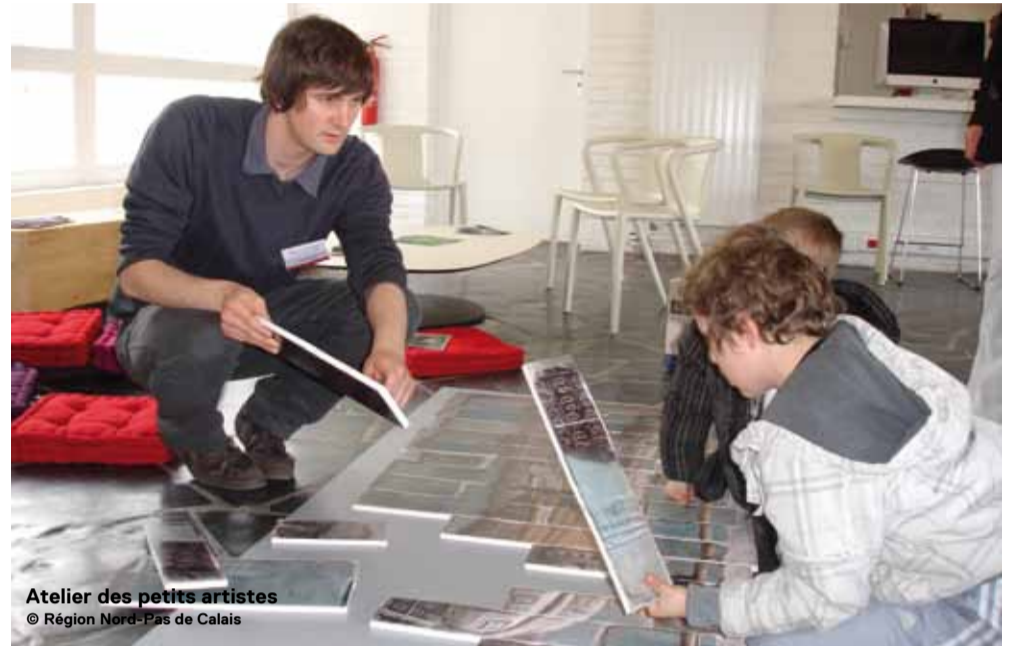
Atelier des petits artistes

La Maison du projet Louvre-Lens et l'Association des conservateurs des musées du Nord-Pas de Calais inaugurent une série