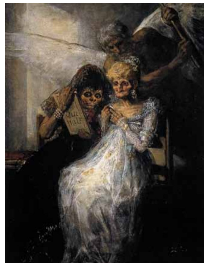
Francisco de GOYA Y LUCIENTES Les Vieilles ou le temps (vers 1810) H. : 0,52 m. ; L. : 0,34 m.