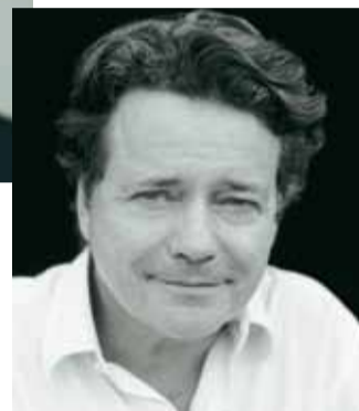
Christian de Portzamparc, architecte urbaniste