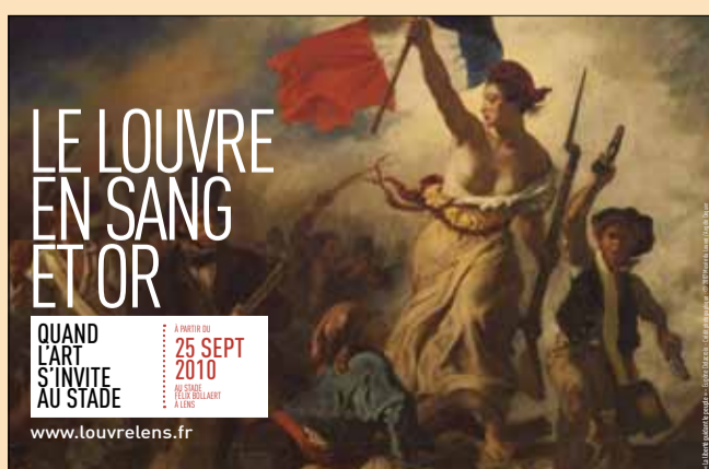
Affiche de l'événement d'après La liberté guidant le peuple d'Eugène Delacroix (détail)

Lancement de l'opération le samedi 25 septembre Durée : toute la saison de football