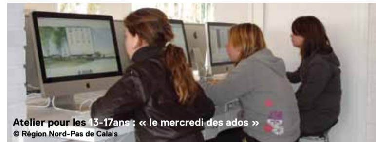
Atelier pour les 13-17ans : « le mercredi des ados »