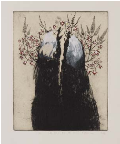
Didier Hamey Les Geishas et le petit oiseau , 2003, pointe sèche rehaussée - Collection de l'artiste