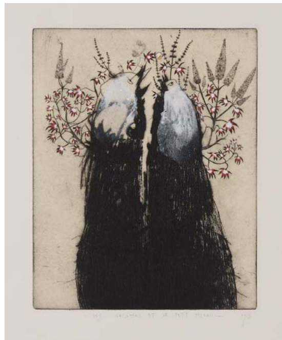
Didier Hamey, Les Geishas et le petit oiseau , 2003, pointe sèche rehaussée - Collection de l'artiste

En parcourant l'œuvre de Didier Hamey, peuplé d'êtres hybrides et joyeux entretenant dans une parfaite harmonie des relations pour le moins équivoques, vient assez rapidement à l'esprit le triptyque du Jardin des Délices de Jérôme Bosch (1453-1516). Cette œuvre magistrale continue de faire débat et l'on cherche encore à décrypter le détail des intentions du peintre qui représente un monde imaginaire fourmillant de personnages dont les attitudes insolites n'ont rien de commun avec une vie terrestre ordinaire. Folie, rêverie, symboles, paraboles, cocasseries, le panneau concentre ces composantes qui laissent si peu de place à la rationalité au profit de la liberté d'imagination. Il est vrai que l'expression de la liberté prise à bras le corps et sans complexe de jugements, donne lieu à la plus grande incompréhension pour un public en recherche permanente de repères.